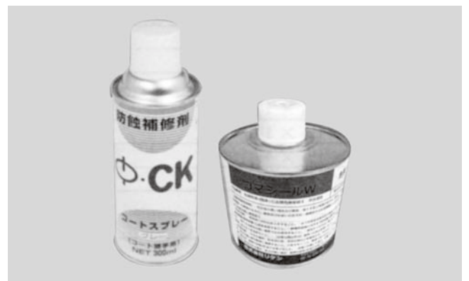
コマ・CKコートスプレー(コマコート品専用補修剤) ¥1,400